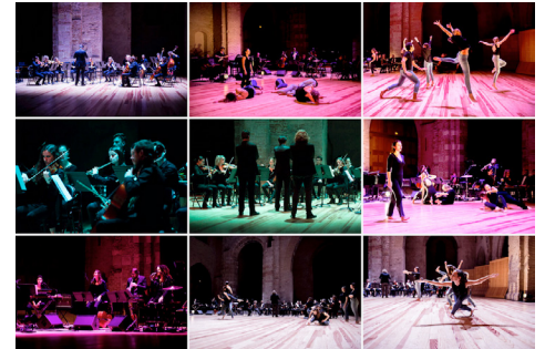
Galerie photo de Regards croisés sur Moondog