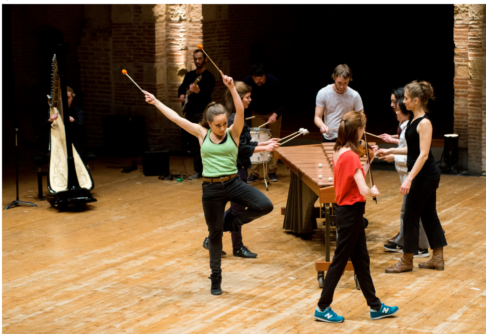
Spectacles d'ouverture des Journées Portes Ouvertes © Franck Alix, mars 2017.