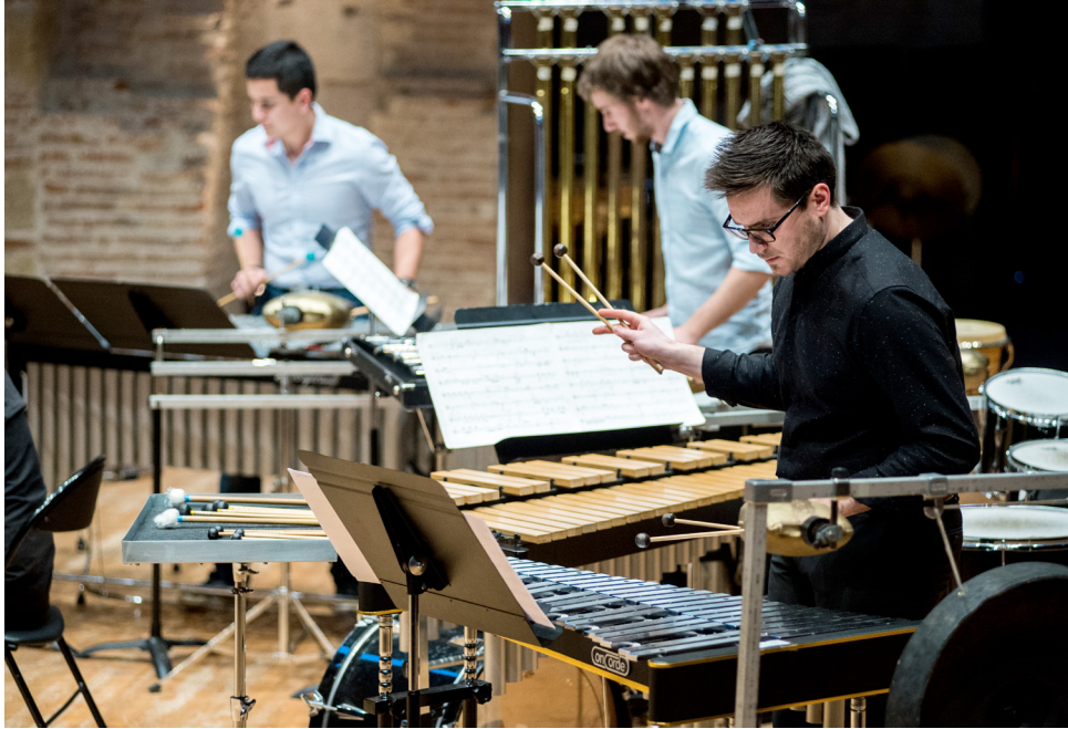
Spectacles d'ouverture des Journées Portes Ouvertes © Franck Alix, mars 2017.