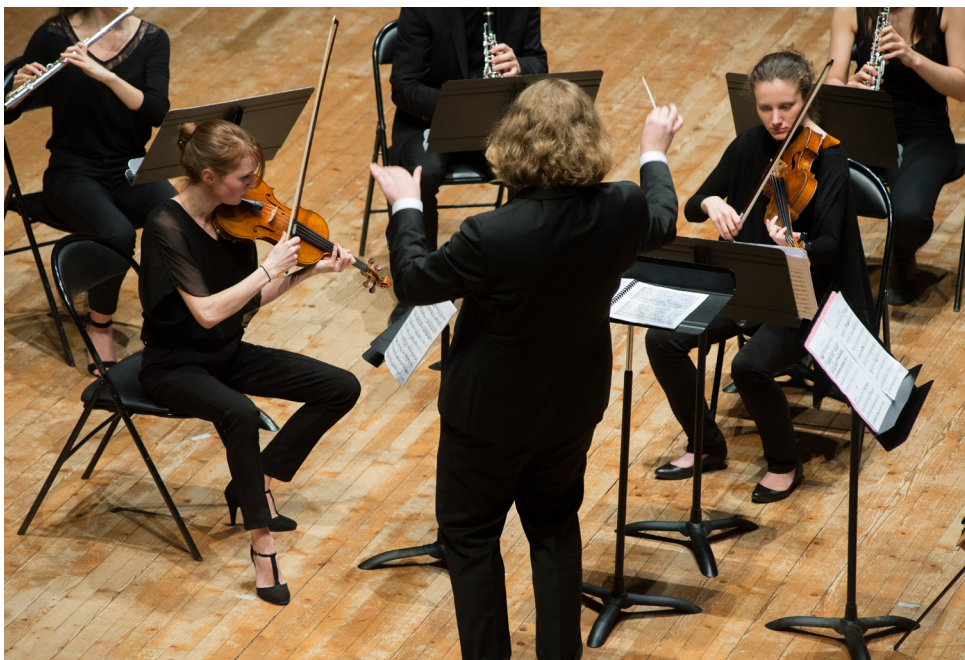
Spectacles de clôture des Journées Portes Ouvertes © Franck Alix, mars 2018.