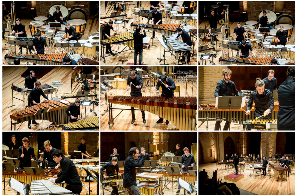
Galerie photo de La Percu'Ose