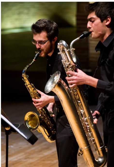
Spectacles d'ouverture des JPO © Franck Alix, mars 2016.