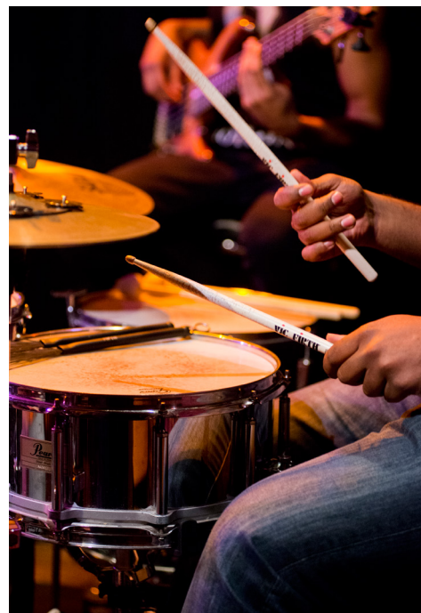
Concert à la Cave Poésie © Franck Alix, février 2016.