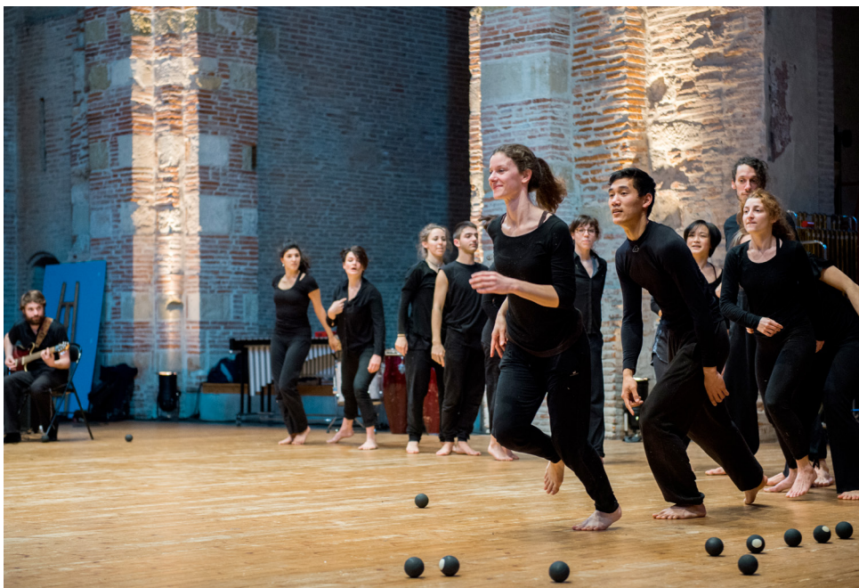
Répétitions des spectacles d'ouverture des Journées Portes Ouvertes © Franck Alix, mars 2017.

Le département spectacle vivant de l'isdaT est l'unique pôle supérieur au plan national à offrir les trois options jazz, classique et contemporain du Diplôme d'État Danse, ainsi que tous les instruments et options pour ses diplômés musicaux – Diplôme d'État Musique et Diplôme National Supérieur Professionnel de Musicien – en formation initiale et continue.