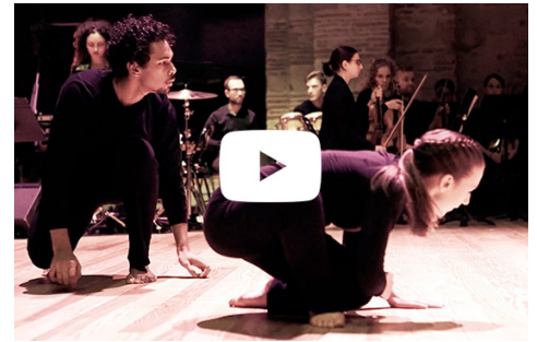
Capture d'après vidéo de Citizen Jif