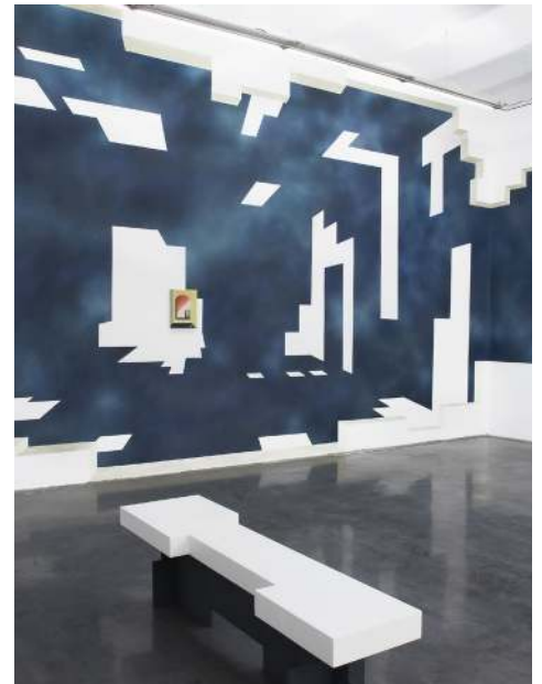
Vue de l'exposition Temps d'un espace-nuit au Frac Occitanie Montpellier, novembre 2018. Œuvres de Rebecca Konforti, diplômée isdaT.