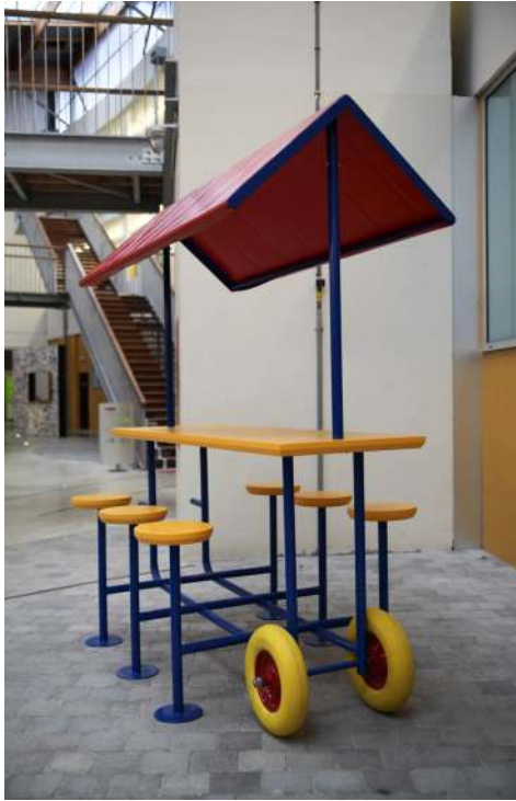
Restitution du workshop « La Rue », Lycée Françoise à Tournefeuille, réalisation Théo Lacroix, 2016.