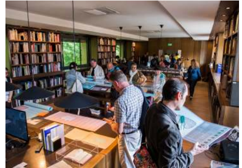
LabBooks – éd. 2018, exposition à la médiathèque des Abattoirs © Franck Alix, juin 2018.