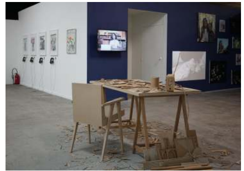
Exposition Activité permanente , étudiants de l'isdaT et artistes invités, BBB Centre d'art © David Coste, mai 2018.