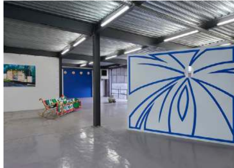
Cliffhangers, exposition des diplômés 2017 à Lieu-Commun, mai 2018.