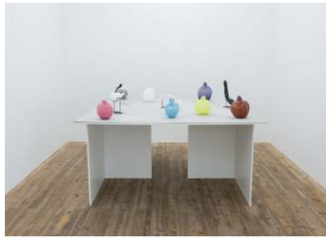
Exposition d'Hugo Bel, Le Choix du Printemps © Franck Alix, juin 2018.