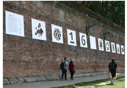
EuroTypoPicto, installation à l'occasion de l'UEFA EURO 2016™ par les étudiants en design graphique de l'isdaT beaux-arts, Toulouse.