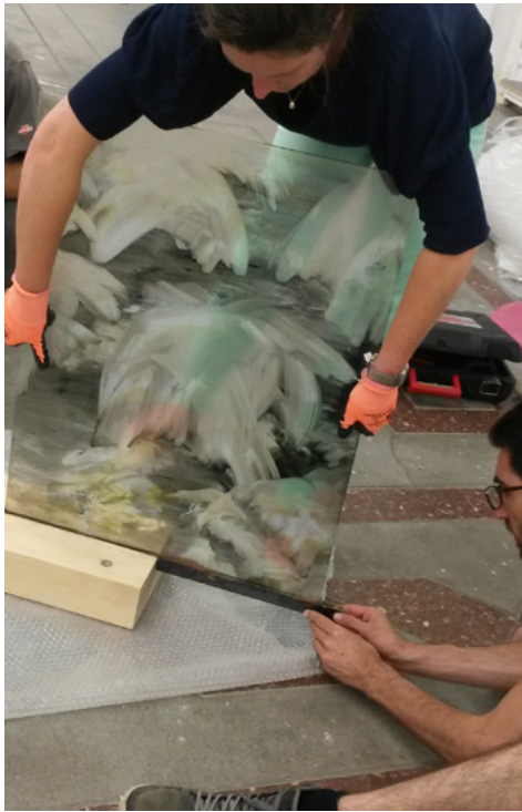
Les bords perdus (montage), exposition d'artistes et designer diplômés de l'isdaT beaux-arts, juillet 2015.