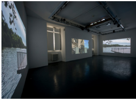
Étienne Kawczak-Wirz, DNSEP art © Franck Alix, juin 2016.