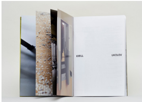
Monographie de Kirill Ukolov (diplômé isdaT beaux-arts).